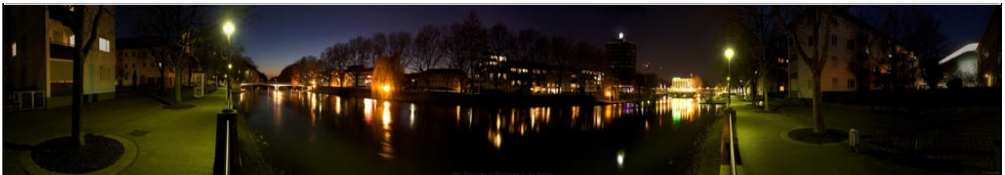
photoreihe: matias möller

Hierbei nutzen die Künstler die Technologie der computergesteuerten Videoprojektion sowie impulsgesteuertes Licht in Verbindung mit einer mehrkanaligen Raumklangkonzeption beziehungsweise lokal eingesetzten, radiophonen Klangräumen.